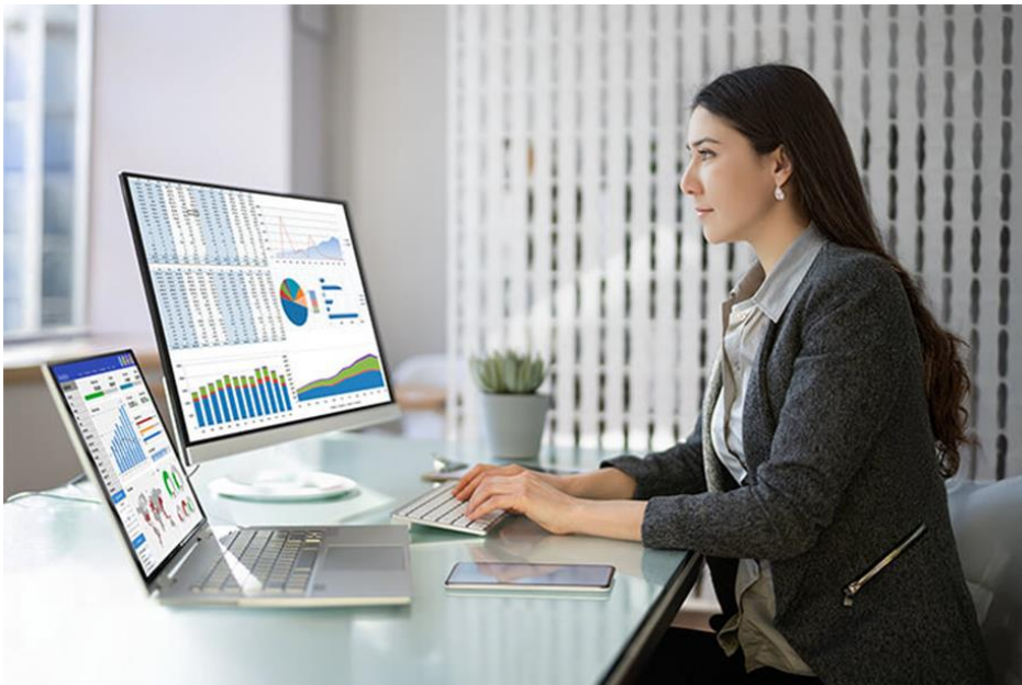
Imagen 4. Avances tecnológicos como herramienta para el cumplimiento fiscal.