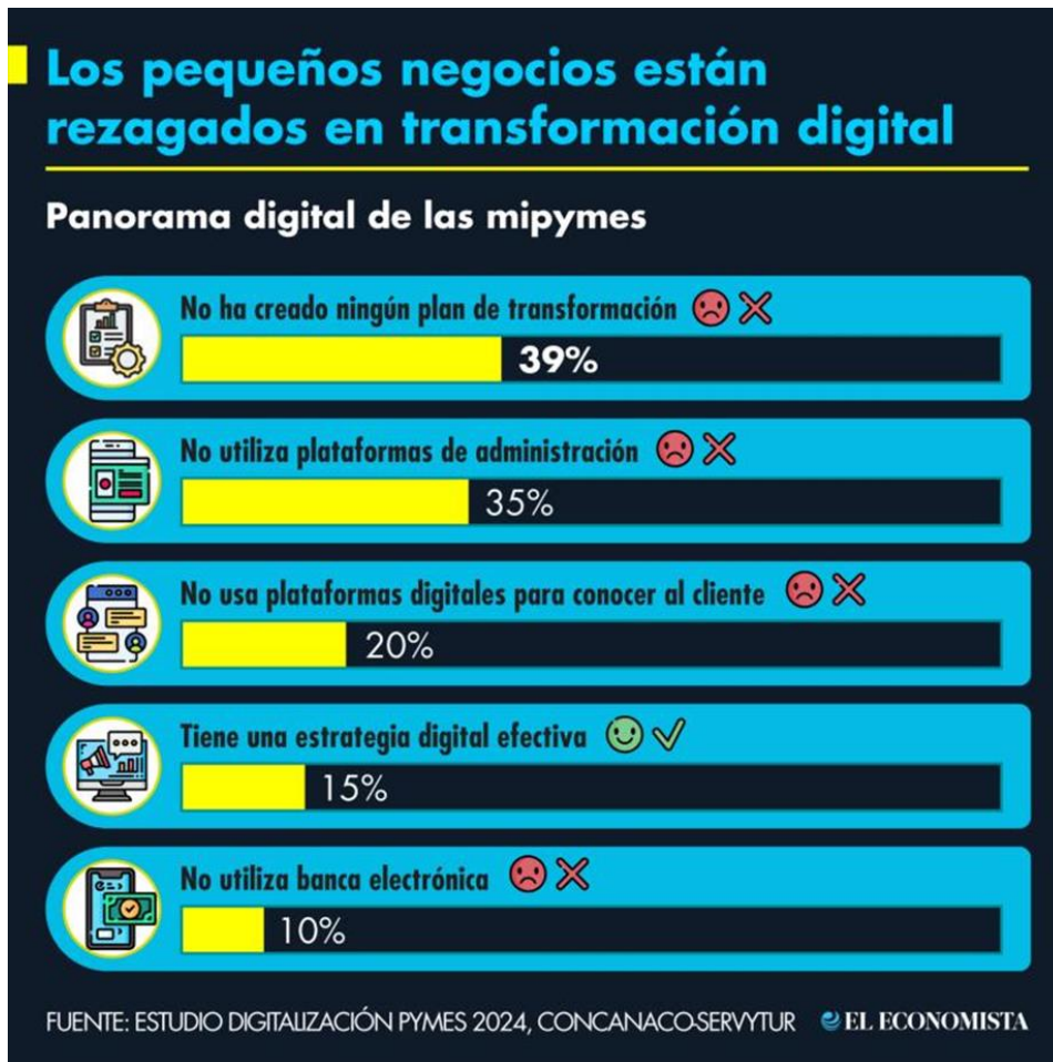
Imagen 2.. Panorama Digital de las MiPyMEs en México. Adaptado de Estudio Digitalización PYMES 2024, por CONCANACO SERVYTUR y El Economista, 2024.

En el sector turístico de Puebla, la digitalización se está impulsando a través de diversas iniciativas. Por ejemplo, se ha implementado el uso de códigos QR en puntos de interés turístico y se promueve la digitalización de negocios locales en Pueblos Mágicos (Jair Velázquez, 2025). Estas acciones buscan mejorar la visibilidad de los destinos y facilitar la interacción con los visitantes, lo que se traduce en un aumento de reservas y una mayor afluencia turística ( Turismo Puebla: Cómo Digitalizar Experiencias Turísticas Y Atraer Visitantes Desde El Buscador - El Creativo Web , 2025).