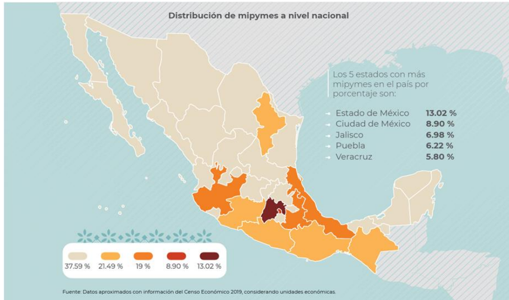
Imagen 1. Distribución de MiPyMEs a nivel nacional por porcentaje en los 5 estados principales (Fuente: Censo Económico 2019, INEGI).

nacional, posicionándose como uno de los cinco estados con mayor concentración de estas empresas (INEGI 2020). La diversidad de las MiPyMEs poblanas abarca desde el comercio al por menor hasta servicios turísticos y manufacturas, reflejando la riqueza cultural y económica de la región.